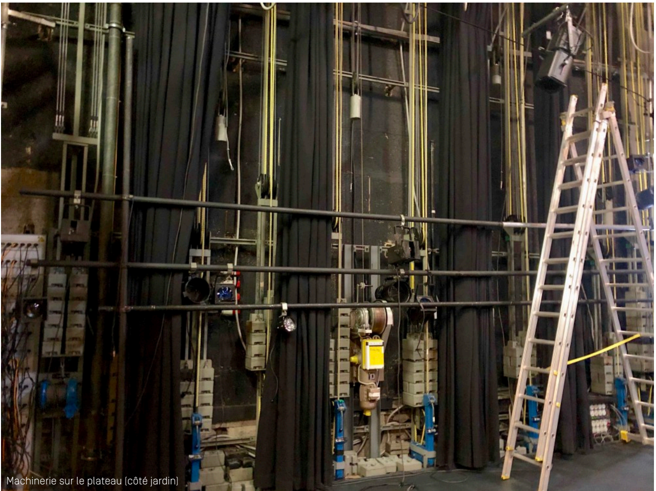
Machinerie sur le plateau (côté jardin)