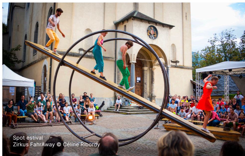
Spot estival Zirkus FahrAway © Céline Ribordy