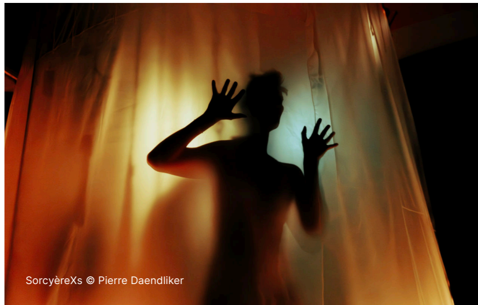
SorcyèreXs © Pierre Daendliker