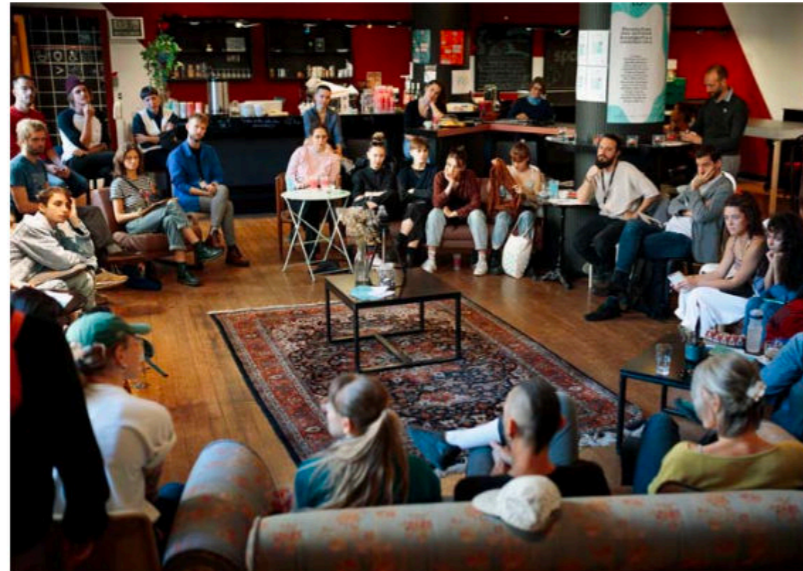
Ce soir à 17 heures, les rencontres s'ouvrent par une grande table ronde où artistes, programmeurs et autorités pourront échanger sur leurs pratiques et les enjeux auxquels ils sont confrontés.