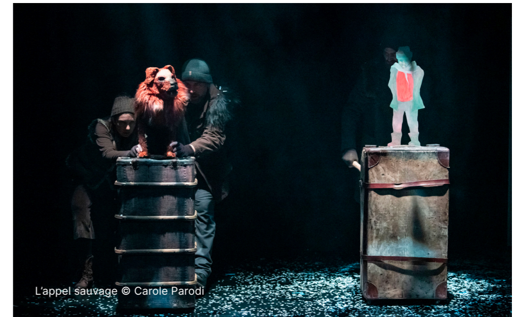
L'appel sauvage