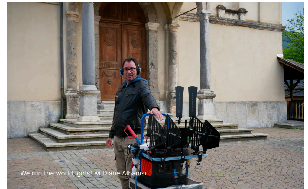
We run the world, girls!