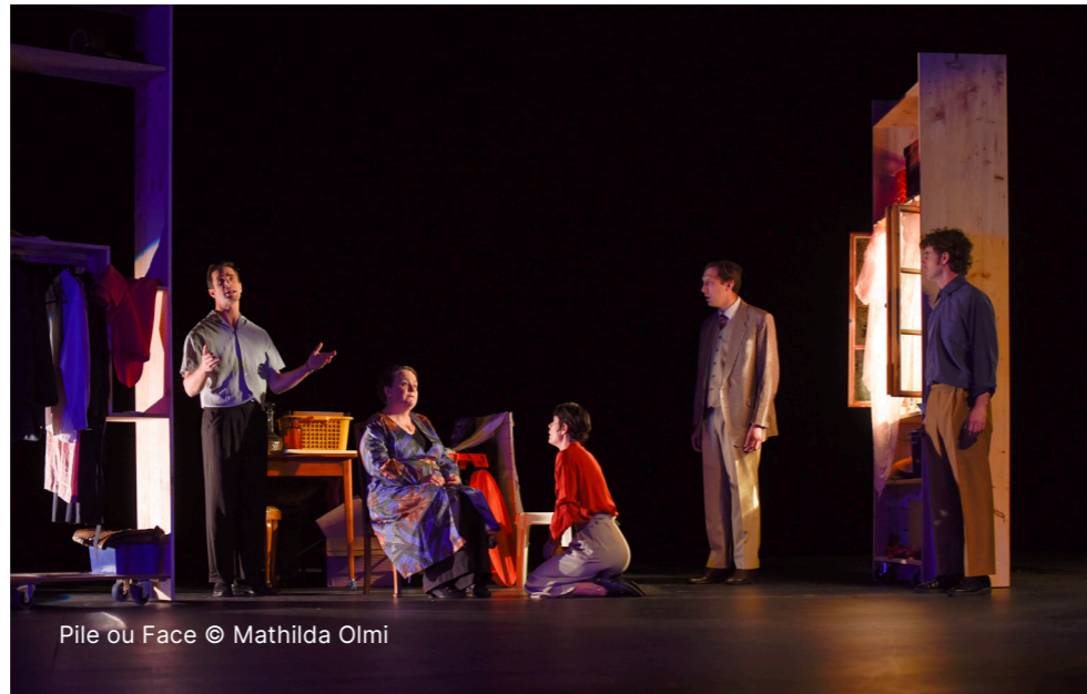
Pile ou Face