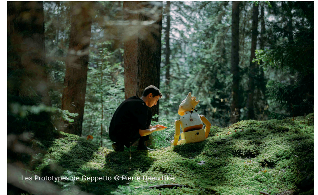
Les Prototypes de Geppetto © Pierre Daendliker