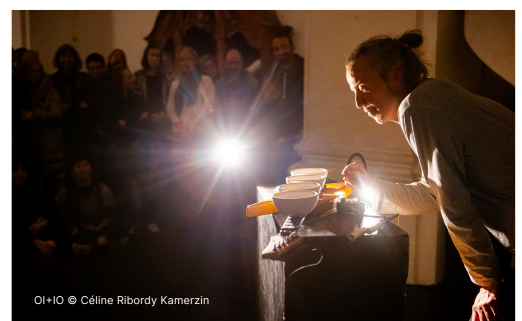
OI+IO © Céline Ribordy Kamerzin