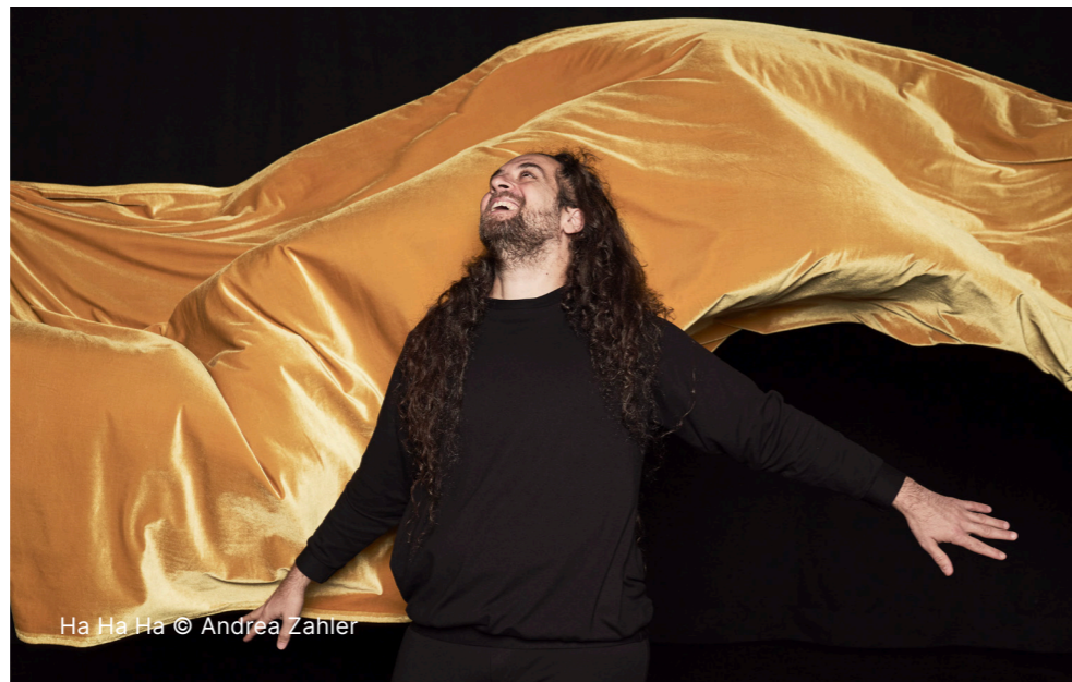
Ha Ha Ha © Andrea Zahler